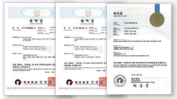
관련 기술 특허증